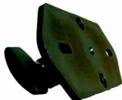
SH-PM para SH-122